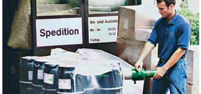
使用FORTE S3对货物托盘和大宗产品进行无焰式热收缩包装。

莱丹公司功率强劲的手动工具。尤其适合货物托盘和大宗产品的热收缩包装，无需明火加热。