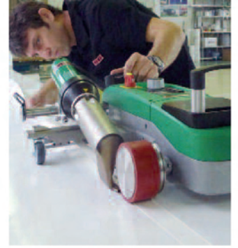
使用相关附件轻松实现折边/穿绳孔结构的焊接