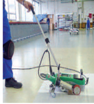
均一无褶皱的交叠焊接